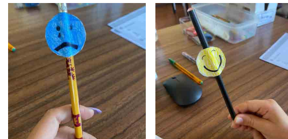
Exemplos dos lápis triste e alegre

Podes colar fazer quatro taumatrópios diferentes, um para cada emoção, e usar cada lápis consoante a emoção que tiveres no momento.